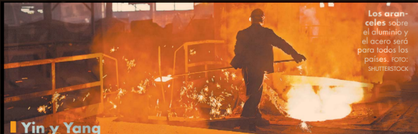
Los aranceles sobre el aluminio y el acero serán para todos los países.

Se concedieron exenciones permanentes a Brasil y Corea del Sur para el acero y a Argentina para el acero y el aluminio a cambio de cuotas. Australia quedó exenta de ambos aranceles. Posteriormente, Trump levantó los aranceles a las importaciones procedentes de Canadá y México y anunció un sistema conjunto de su-