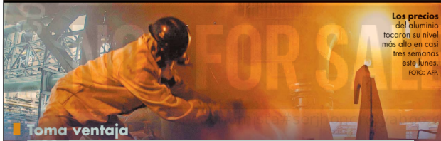
Los precios del aluminio tocaron su nivel más alto en casi tres semanas este lunes.